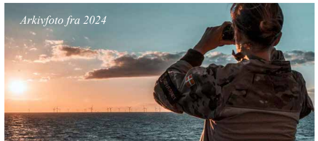
Arkivfoto fra 2024

Som støtte til indsatsen skærper Danmark sin overvågning af farvandene omkring Danmark, herunder den vestlige del af Østersøen. Forsvaret vil i perioden støtte Baltic Sentry med fly, skibe og andre relevante kapaciteter. Overvågningsopgaven koordineres af det Nationale Maritime Operationscenter i Karup.