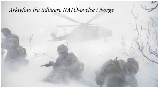
Arkivfoto fra tidligere NATO-øvelse i Norge

I den første del af Steadfast Defender deltog Forsvaret i Joint Warrior 24, der var en britisk ledet maritim øvelse i farvandet vest for Norge, samt den norskledede øvelse Nordic Response 24, som foregik i den ekstreme kulde i Nordens arktiske områder.