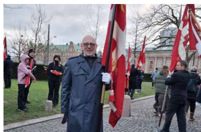
En fantastisk, men kold oplevelse

Hendes majestæt Dronning Margrethes abdikation blev i den grad en nyhed, der satte vores land på den anden ende i starten af 2024. Hans majestæt Kong Frederik X overtog tronen efter sin mor. En stor slæt og uforglemmelig begivenhed, som undertegnede deltog i med vores selskabs fane sammen med ca. 600 andre faner fra alle egne og foreninger over det ganske land. Det var en helt overvældende oplevelse at være sammen med flere hundrede tusinde glade feststemte mennesker der fejrede tronskiftet, trods blæst og en bidende kulde.