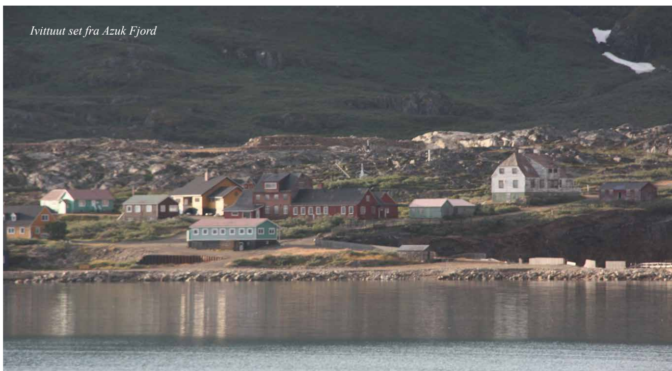
Ivittuut set fra Azuk Fjord

Selvom minedriften er forbi, har Ivittuut efterladt sig en værdig arv. Kryolitens rolle i udviklingen af aluminiumindustrien og de industrielle processer i det 20. århundrede har haft en enorm indflydelse på den moderne verden. Ivittuut er et symbol på den ressourcetrang, der drev global industrialisering, og på de muligheder og udfordringer, der følger med at udnytte naturressourcer på steder som Grønland.