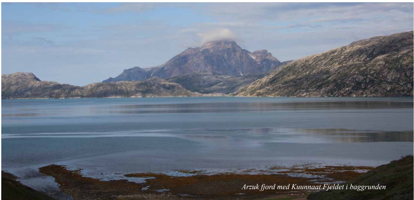
Arzuk fjord med Kuunnaat Fjeldet i baggrunden

Den næste base, Danmark skulle overtage var Grønødal.