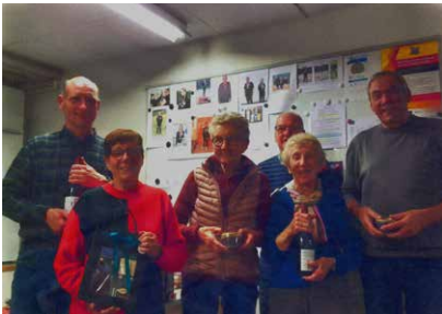
Billede af præmiemodtagerne.

Vi havde lånt skytteforeningens lokaler i Kongsted, det var en spændende skydning hvor vores erfarne skytter, hjalp de mindre erfarne