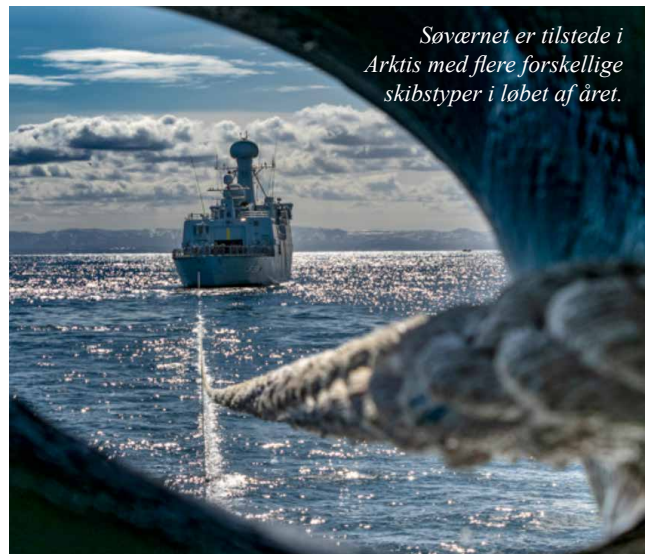
Søværnet er tilstede i Arktis med flere forskellige skibstyper i løbet af året.

Som elev på Arktisk Basisuddannelse vil du gennemføre en spændende værn-fælles basisuddannelse med et beredskabsmæssigt fokus og samtidig skabe forudsætning for at videreudanne dig i Forsvaret. Efter gennemførelse af uddannelsen får du nemlig mulighed for at fortsætte din uddannelse og karriere i Søværnet, Flyvevåbnet eller Hæren, såvel som i Forsvaret generelt. Du vil blive uddannet bredt i soldaterfærdigheder og løsningen af beredskabsmæssige opgaver, og vil som elev blive en del af et unikt fællesskab, hvor du samarbejder med både civile og militære kollegaer.