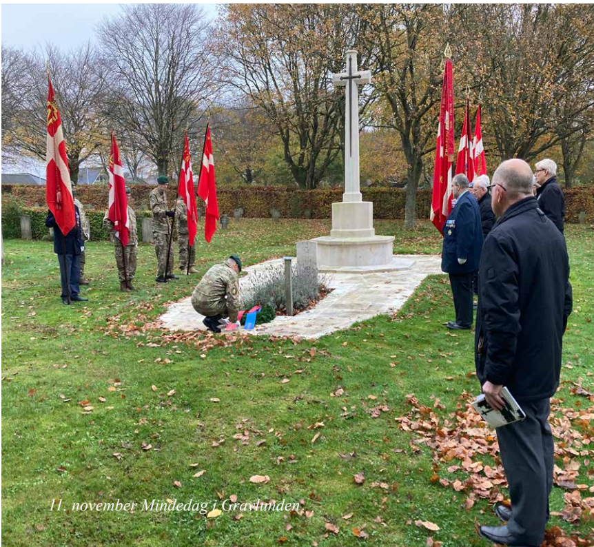
11. november Mindedag i Gravlunden