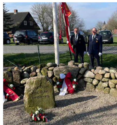
Mindesmærket for de to faldne danske soldater