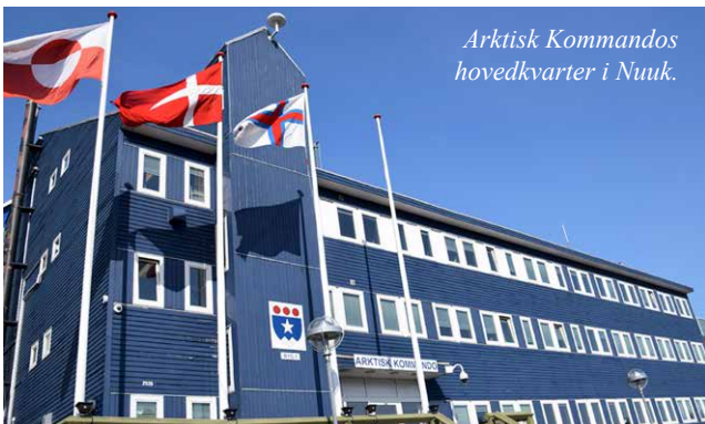
Arktisk Kommandos hovedkvarter i Nuuk.

Den 31. oktober 2012 blev Grønlands og Færøernes Kommando lagt sammen under navnet Arktisk Kommando, der er en værn-fælles operativ kommando med tjenestegørende personel fra Hæren, Søværnet og Flyvevåbnet, Forsvarets styrelser og civile. Samtidigt blev hovedkvartererne i Grønnedal og Mørkedal lukket, og den fælles kommando fik hovedkvarter i Nuuk.