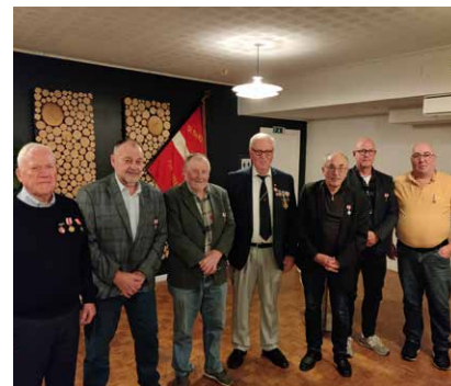
Den nye bestyrelse

Vi gennemførte årets generalforsamling i vante omgivelser – i Tølløse hallen. Bestyrelsen blev konstitueret således: