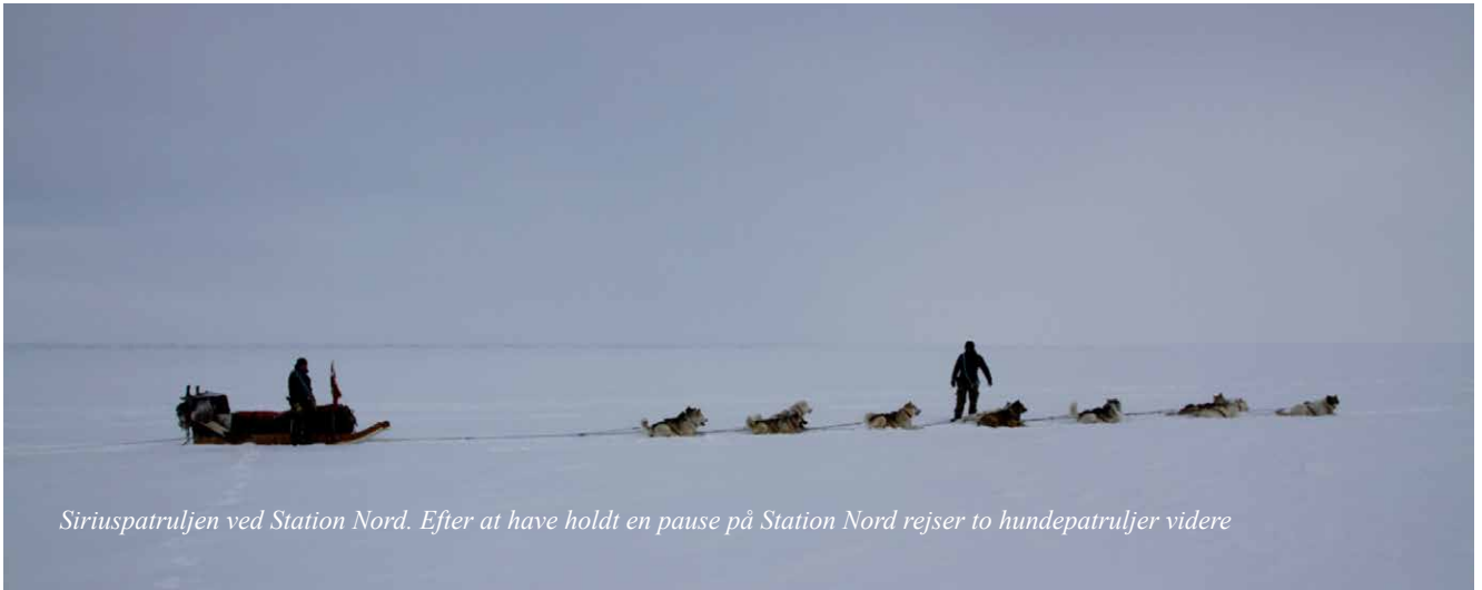
Siriuspatruljen ved Station Nord. Efter at have holdt en pause på Station Nord rejser to hundepatruljer videre