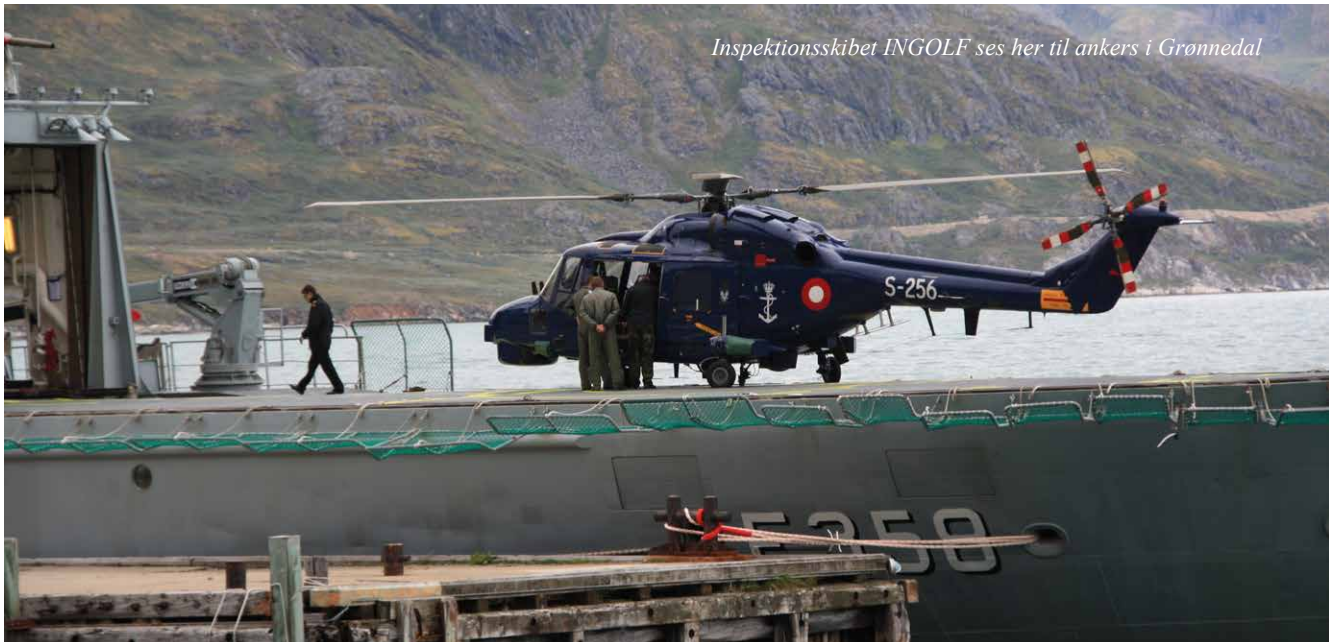
Inspektionsskibet INGOLF ses her til ankers i Grønmedal