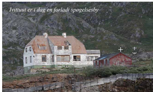
Ivittuut er i dag en forladt spøgelsesby

Efter krigens afslutning var behovet for kryolit mindre, og produktionen i Ivittuut begyndte at falde. I 1960'erne blev minearbejdet i Ivittuut gradvist udfaset, og de sidste store udvindingsperioder sluttede i 1980'erne. Der var flere årsager til denne nedgang, både ændringer i markedet for kryolit og teknologiske fremskridt, som reducerede behovet for mineralet i aluminiumproduktionen, spillede en rolle. I 1987 blev Ivittuut-området officielt lukket for kommerciel minedrift, og byen blev hurtigt forladt.